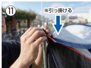
11 キャンピー部の両端についている輪っかを キャンピーポールの先端に引っ掛ける。