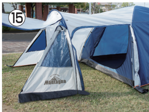
15 キャンピー部と側面(片面のみ)は、 ファスナーで開閉が可能です。