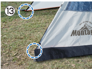
13 前室部の2箇所をペグで固定する。