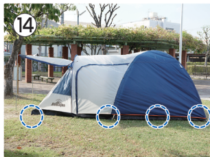
14 テント底面の輪っか部(各所)に ペグを差し込んで固定する。