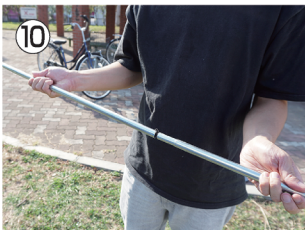
10 キャンピーポールを組み立てる。 (詳しくは「キャンピーポールの組み立て方」参照)