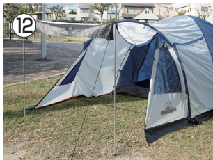
12 キャンピーポールが自立するように、 ロープとペグで固定する。